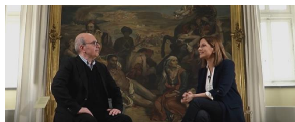
Συνέντευξη, Καθηγητής Αριστέιδης Χατζής, Εκπομπή «Μεγάλη Εικόνα», Mega.

• Ο Καθηγητής του ΙΦΕ Αριστέιδης Χατζής μίλησε στην εκπομπή του Mega «Μεγάλη Εικόνα» και την κ. Νίκη Λυμπεράκη με αφορμή την Εθνική Επέτειο της 25ης Μαρτίου 1821. Απαρχή της συζήτησής τους στάθηκε ο τίτλος του βιβλίου του Καθηγητή κ. Χατζή για την Ελληνική Επανάσταση