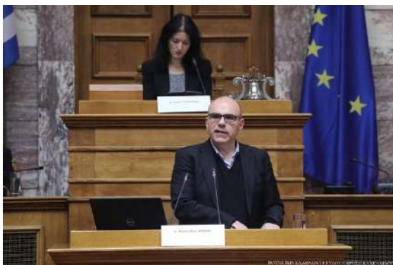
Ομιλία Καθηγητή Αριστείδης Χατζή, Αίθουσα Γερουσίας, Βουλή των Ελλήνων

Ιδεών έλαβε χώρα στο μέγαρο της Βουλής των Ελλήνων και ειδικότερα στην ιστορική αίθουσα της Γερουσίας. Το συνέδριο με τίτλο « Το 1821 στην Πρώτη Σελίδα: Η Ελληνική Επανάσταση στον Διεθνή και Εγχώριο Τύπο » συνδιοργανώθηκε με τη Βιβλιοθήκη της Βουλής των Ελλήνων και τη Βρετανική Σχολή Αθηνών. Είχε δύο ομιλίες και 29 εισηγήσεις.