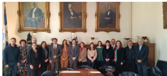
Από την τελετή ορκωμοσίας, Κεντρικό Κτήριο, ΕΚΠΑ

tom Research and Training Programme) και "RISK CHANGE" (EE Creative Europe). Ως διδακτορική φοιτήτρια συμμετείχε στα διεθνή ερευνητικά έργα "Papyrus: Cultural and historical digital libraries dynamically mined from news archives" (EE FP7) και "Inventing Europe: Technology and the Making of Europe, 1850 to the Present" (European Science Foundation).