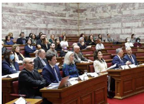
Συνεδροί και κοινό, «Πρώτη Σελίδα: Η Ελληνική Επανάσταση στον Διεθνή και Εγχώριο Τύπο», Αίθουσα Γερουσίας, Βουλή των Ελλήνων

νο χώρο, από το 1821 μέχρι το 1832, δηλαδή 1.770 ξεχωριστά τεύχη, 8.300 σελίδες, πάνω από 30.000 διαφορετικά δημοσιεύματα (ειδήσεις, ειδησάρια, άρθρα, επιστολές, ανακοινώσεις, επίσημα έγγραφα). Έχουν, επίσης, αποδελτιωθεί (για ό,τι αφορά την Ελληνική Επανάσταση) η επίσημη εφημερίδα των Ιονίων Νήσων που κυκλοφορούσε στα Επτάνησα και η εφημερίδα Times του Λονδίνου.